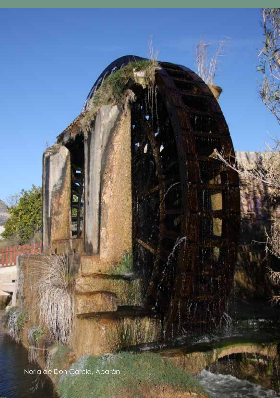
Noria de Don García, Abarán